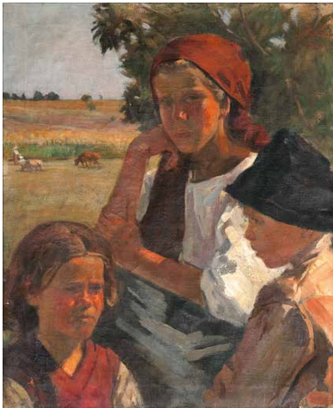
In the Meadow (First version) | În luncă (Prima versiune)

1946, Oil on Canvas, 74-61 cm. Private collection, Rishon Le-Zion | 1946, Ulei, pânză, 74-61 cm. Colecție privată, Rishon Le-Zion