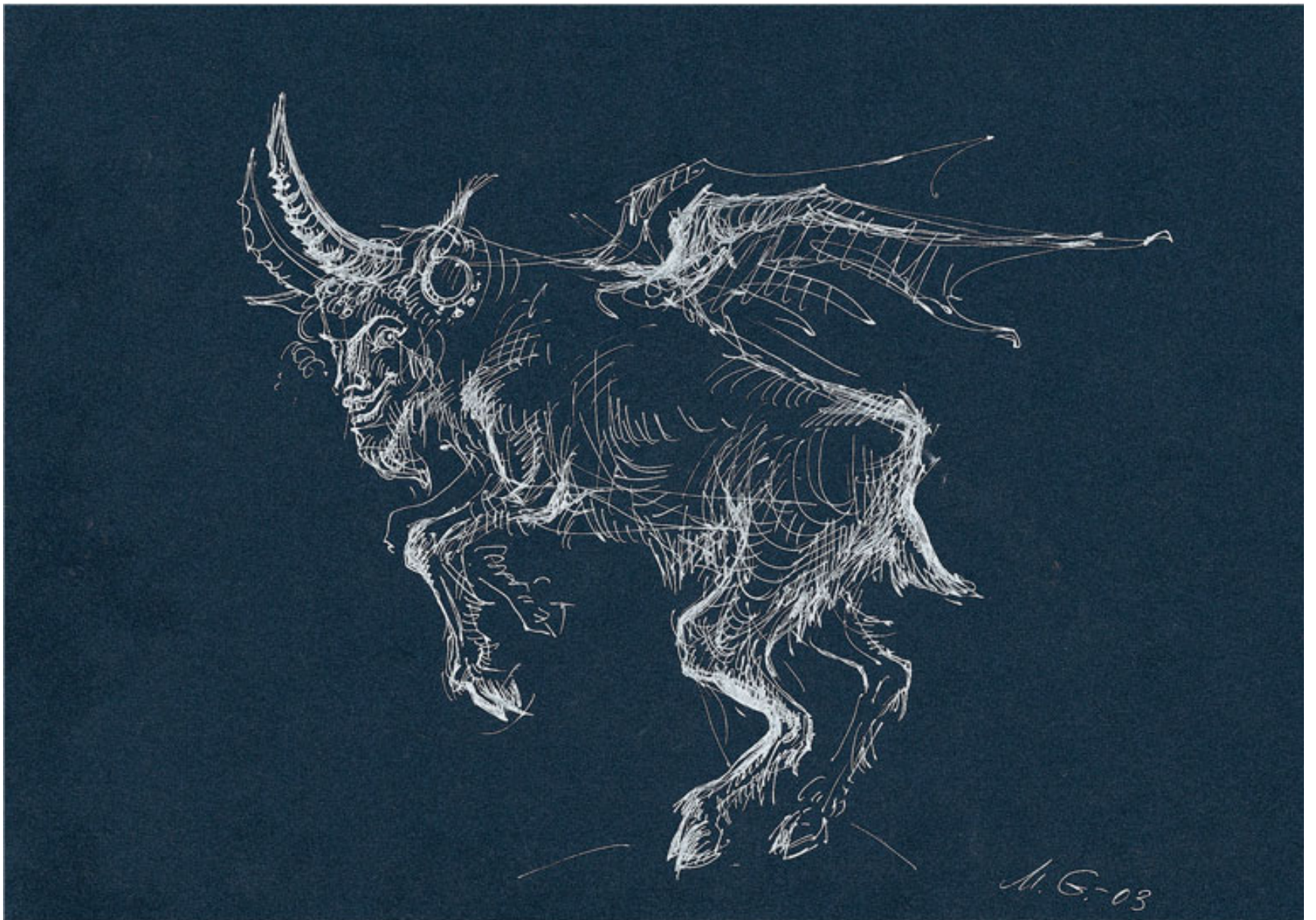
שהרי לילית זו צורתה משא"כ תיש, עט כסף על נייר צבעוני, 21/29.5, 2003