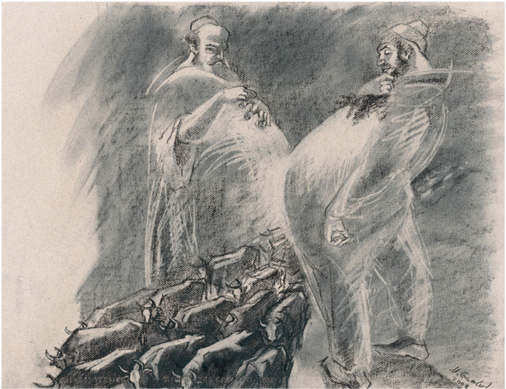
יכל צמד שוורים להיכנס ביניהם, ולא היה נוגע בהם, פחם ומחק על נייר צבעוני, 50/65, 2003