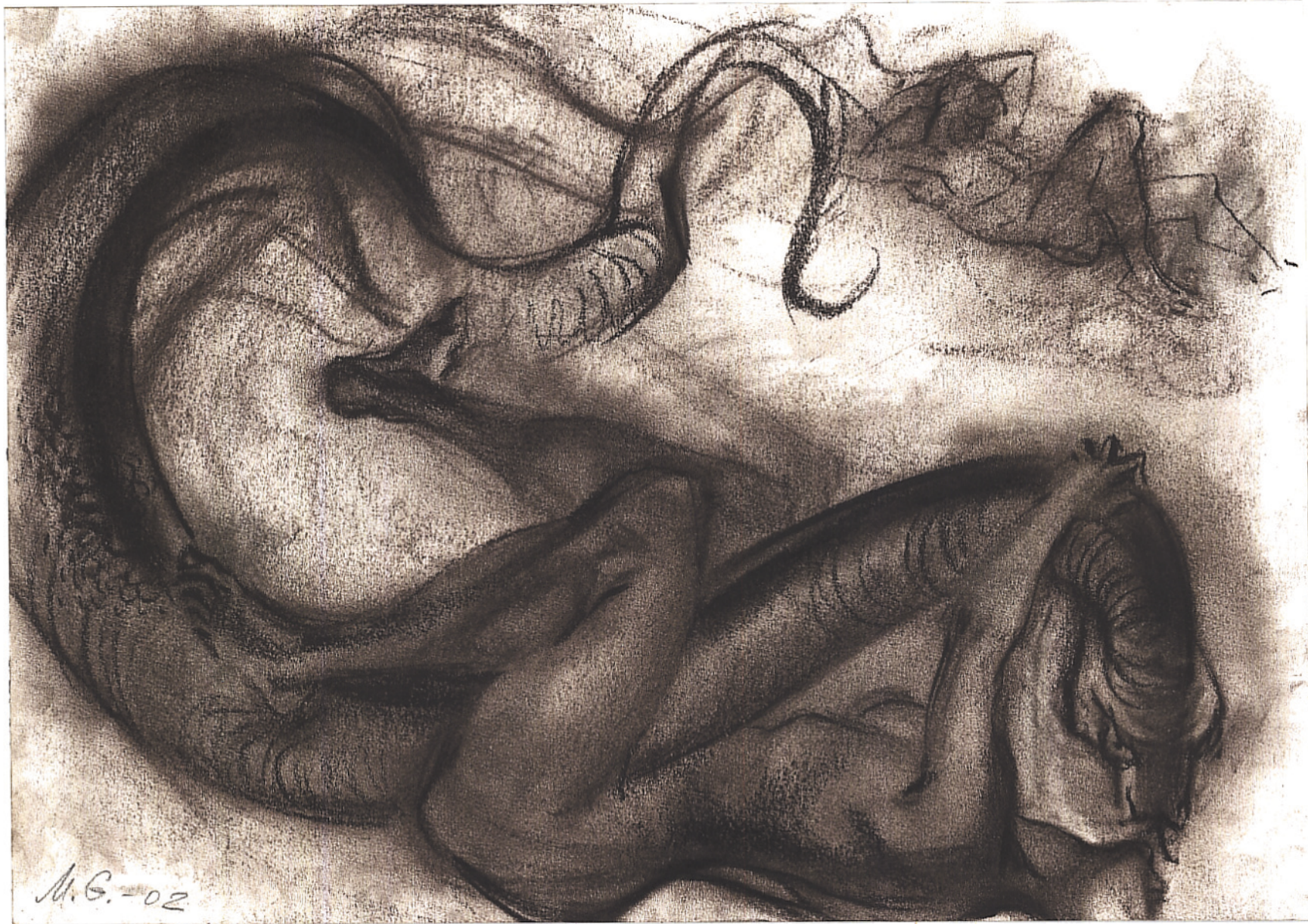
ולבסוף נתקללה חוה, פסטל על נייר, 30/42, 2002