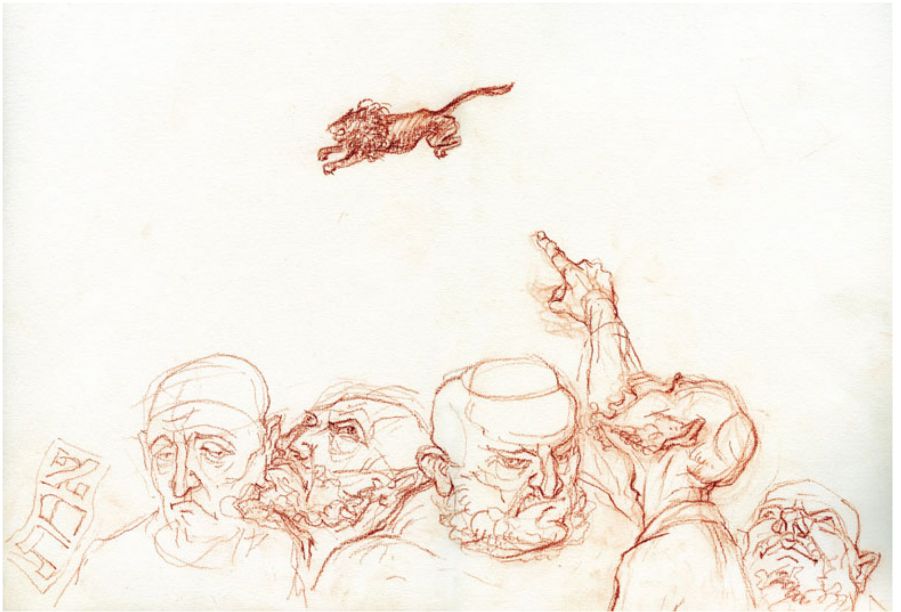
זה יצר הרע, עיפרון 29.5/42, sanguine, 2010