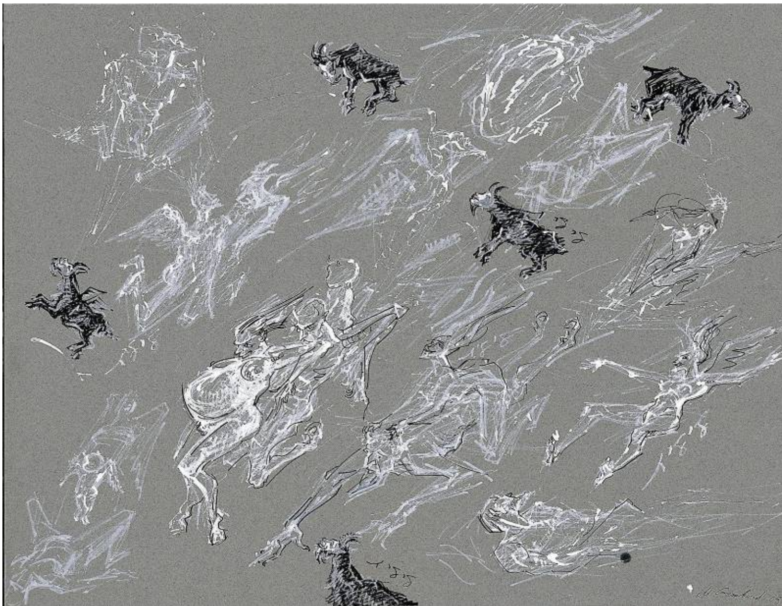
הוליד רוחין ושדין ולילין, עט שחור ועט לבן על נייר צבעוני, 50/65, 2003