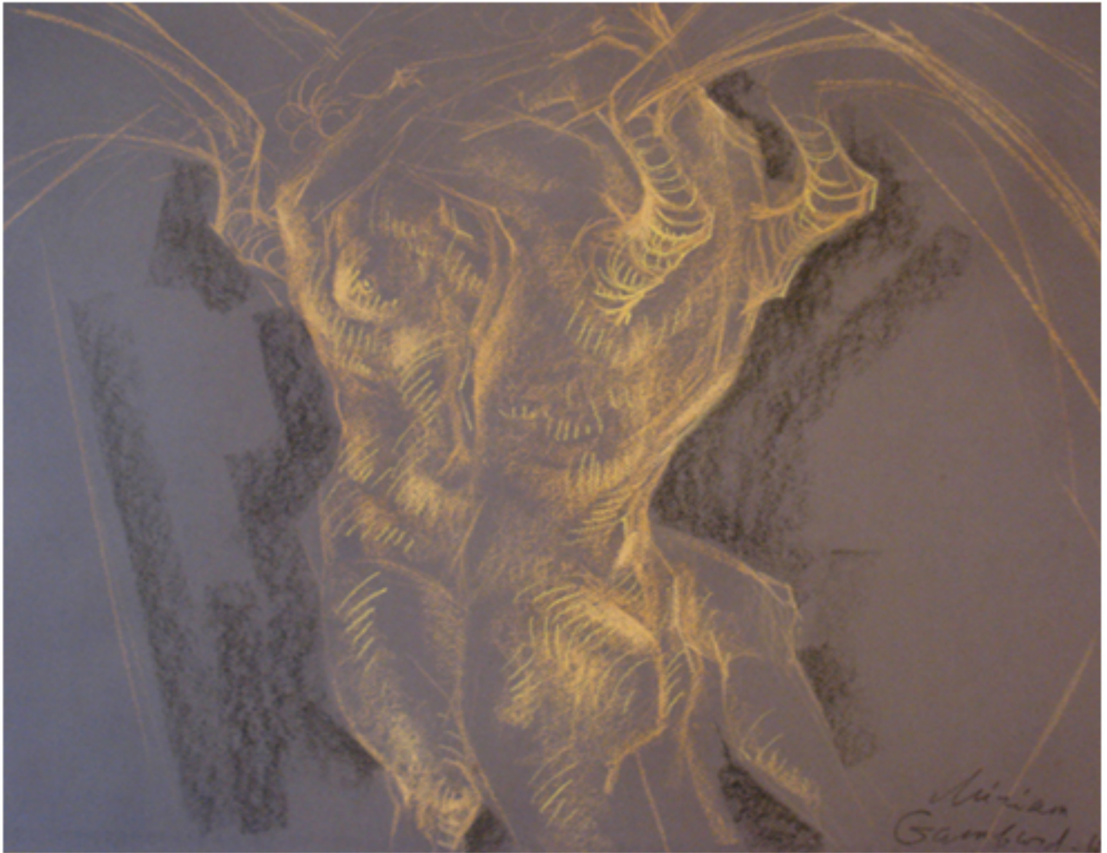
כרובים מעורין זה בזה, פסטל ונייר צבעוני, 49/64, 2002