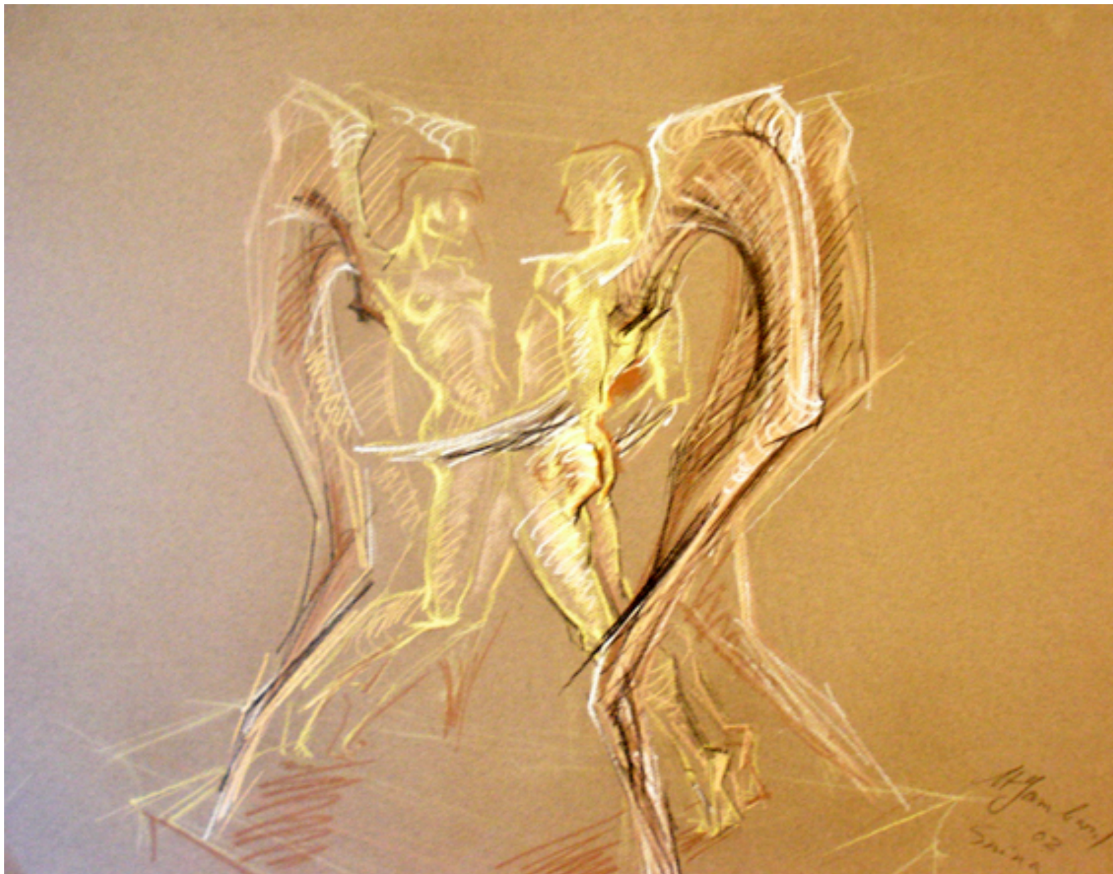
כרובים מעורין זה בזה, פסטל ונייר צבעוני, 49/64, 2002