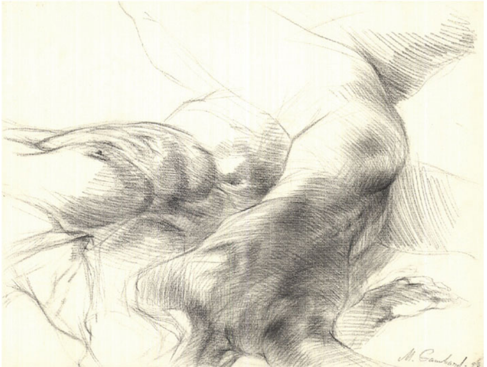
זו קרוב בשר, גרפיט ועיפרון על נייר, 50/65, 1998