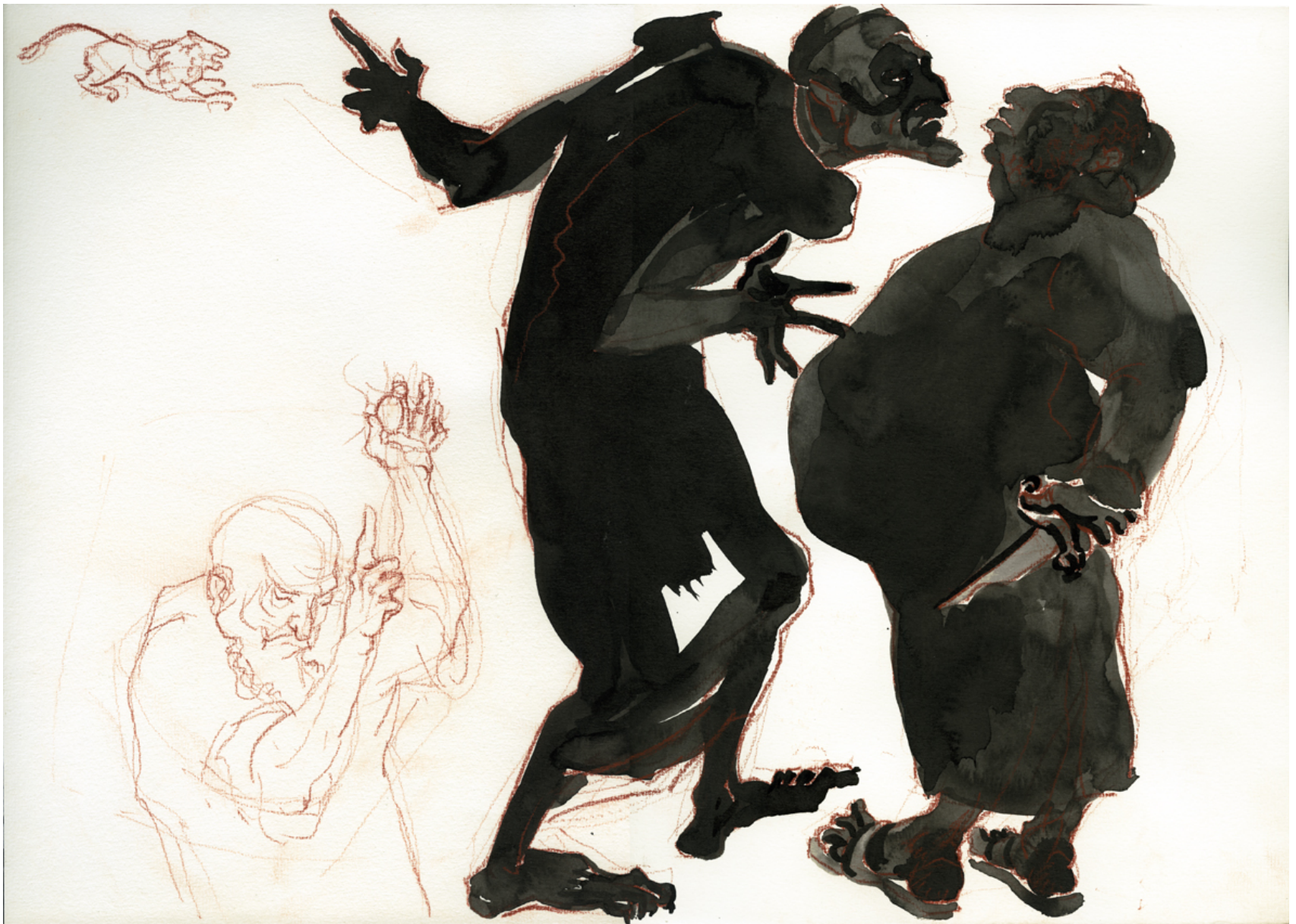
ראו, שאם הורגים אתם אותו- יכלה העולם, עיפרון sanguine ודיו ומכחול, 29.5/42, 2010