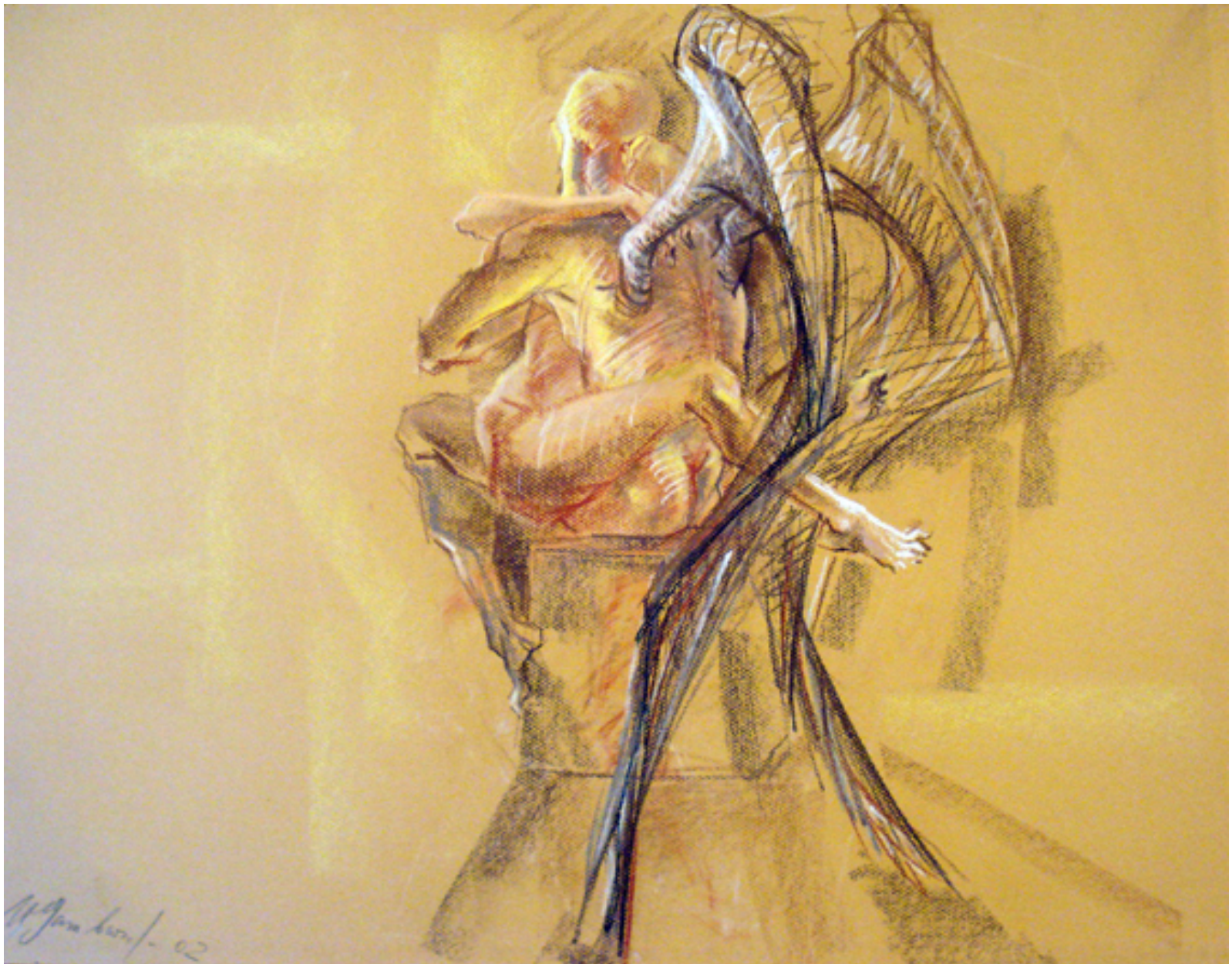
כרובים מעורין זה בזה, פסטל ונייר צבעוני, 49/64, 2002