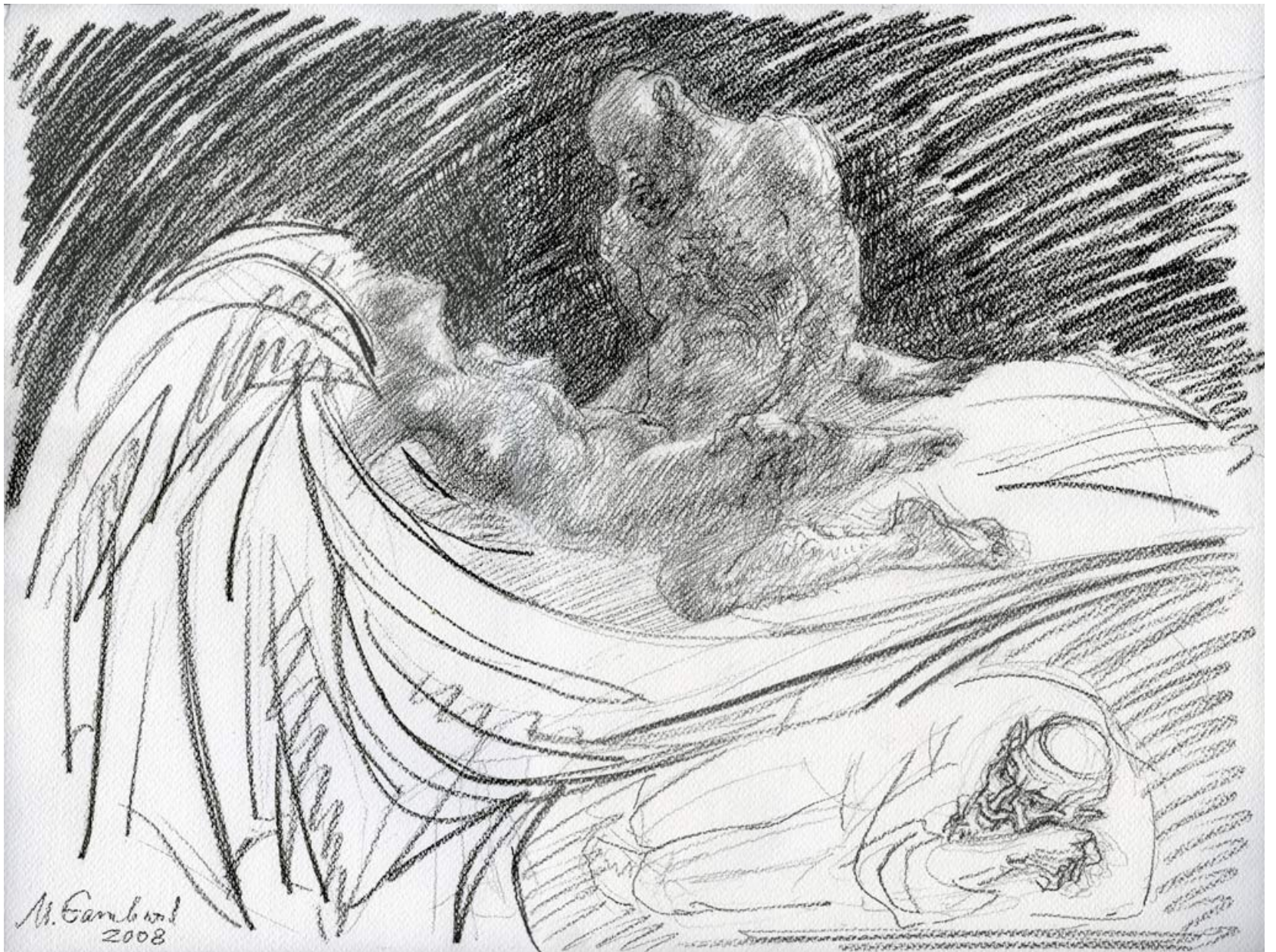
שכב תחת מיטתו של רב, עיפרון פחם על נייר, 29.5/41, 2008