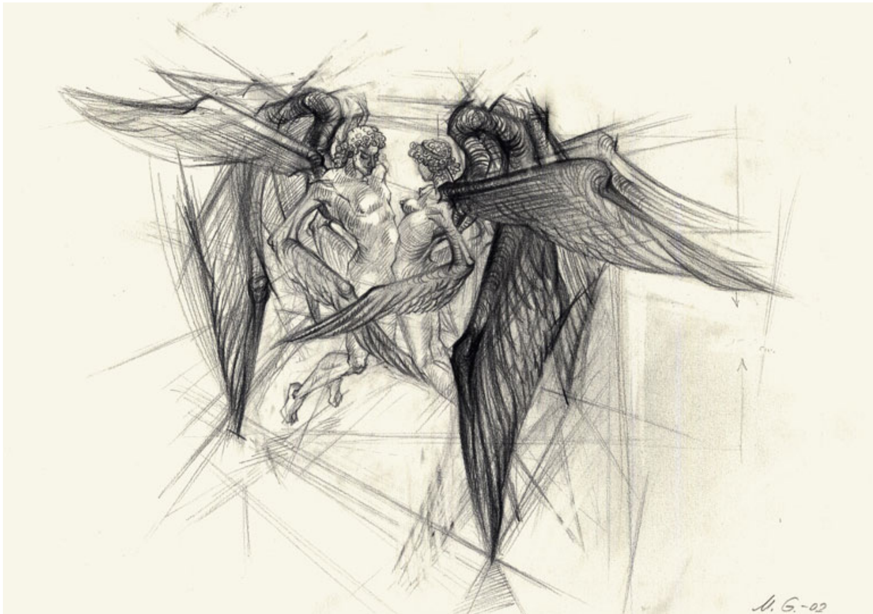
הכרובים שהיו מעורין זה בזה, עיפרון עופרת על נייר, 30/42, 2002